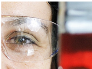
Stapje dichterbij goedkopere medicijnen