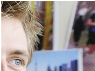
Vreselijk veel zin om naar Ghana te gaan